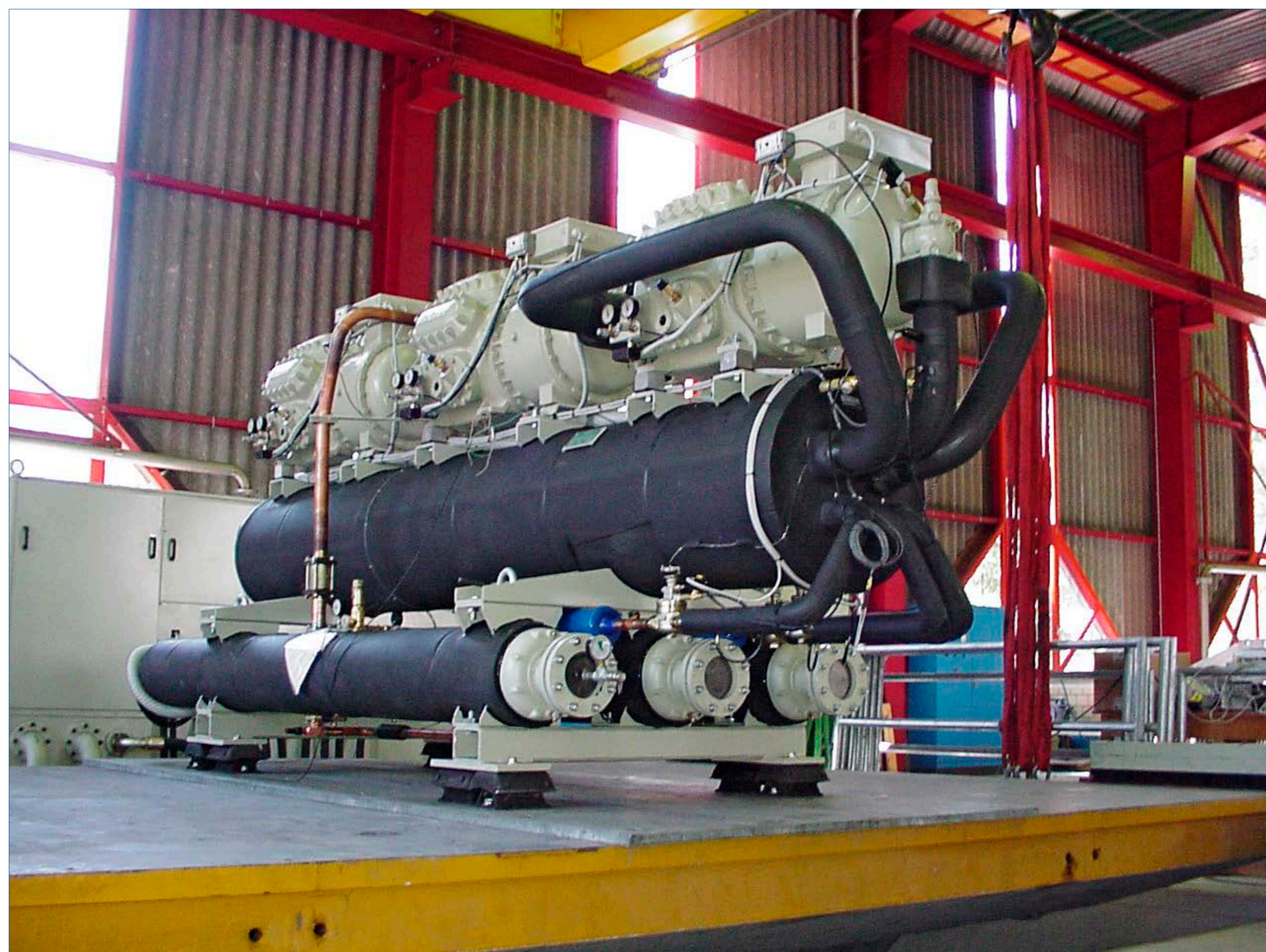
Prüfobjekt (Kältemaschine), X-Achse