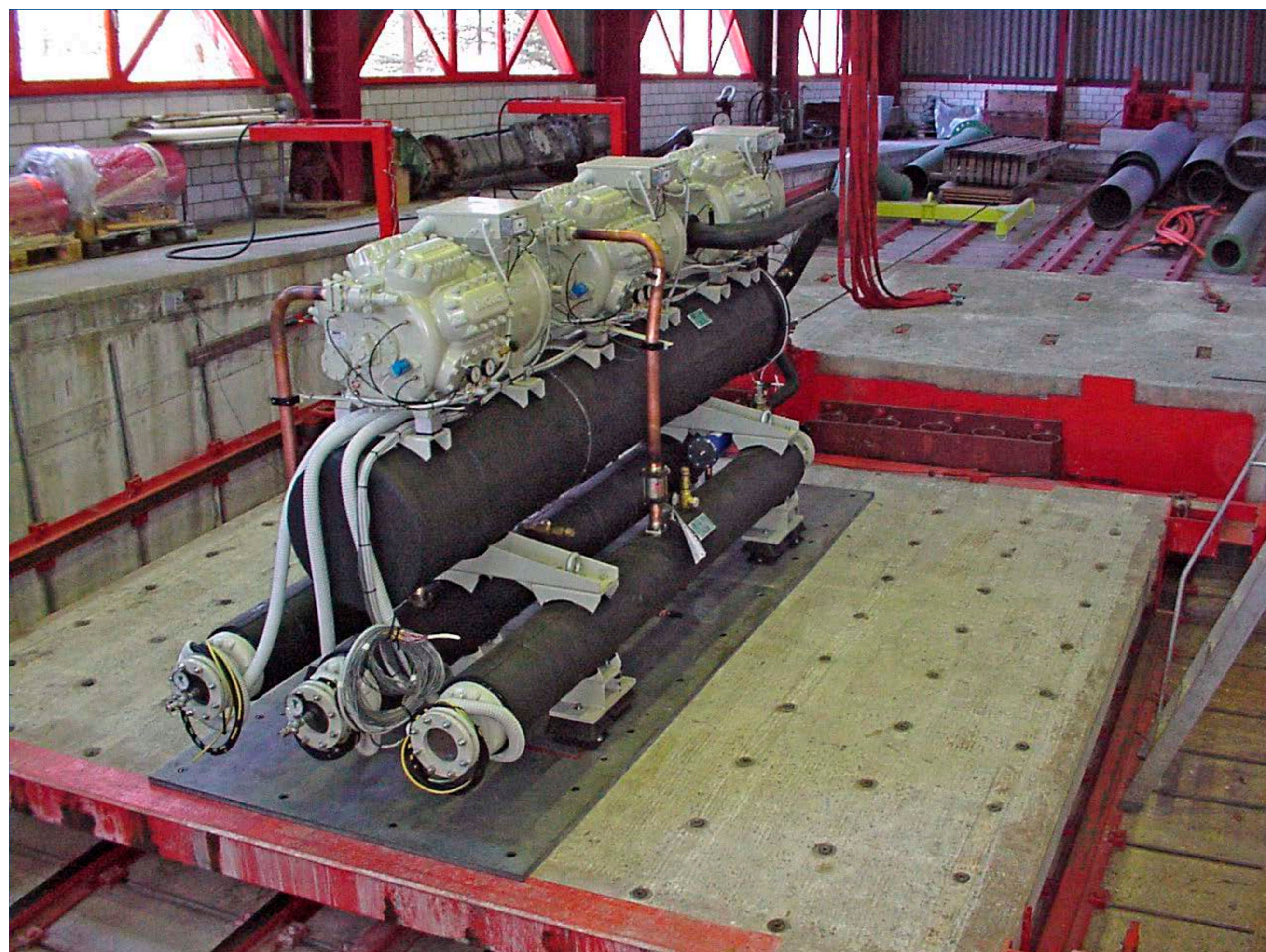
Prüfobjekt (Kältemaschine), Y-Achse